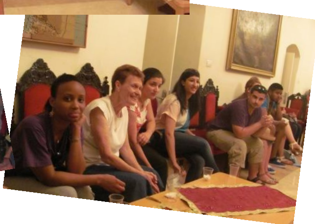
Rencontre avec les jeunes de la Paroisse de la Sainte Famille

** des pèlerins du diocèse d'Annecy (Haute Savoie)