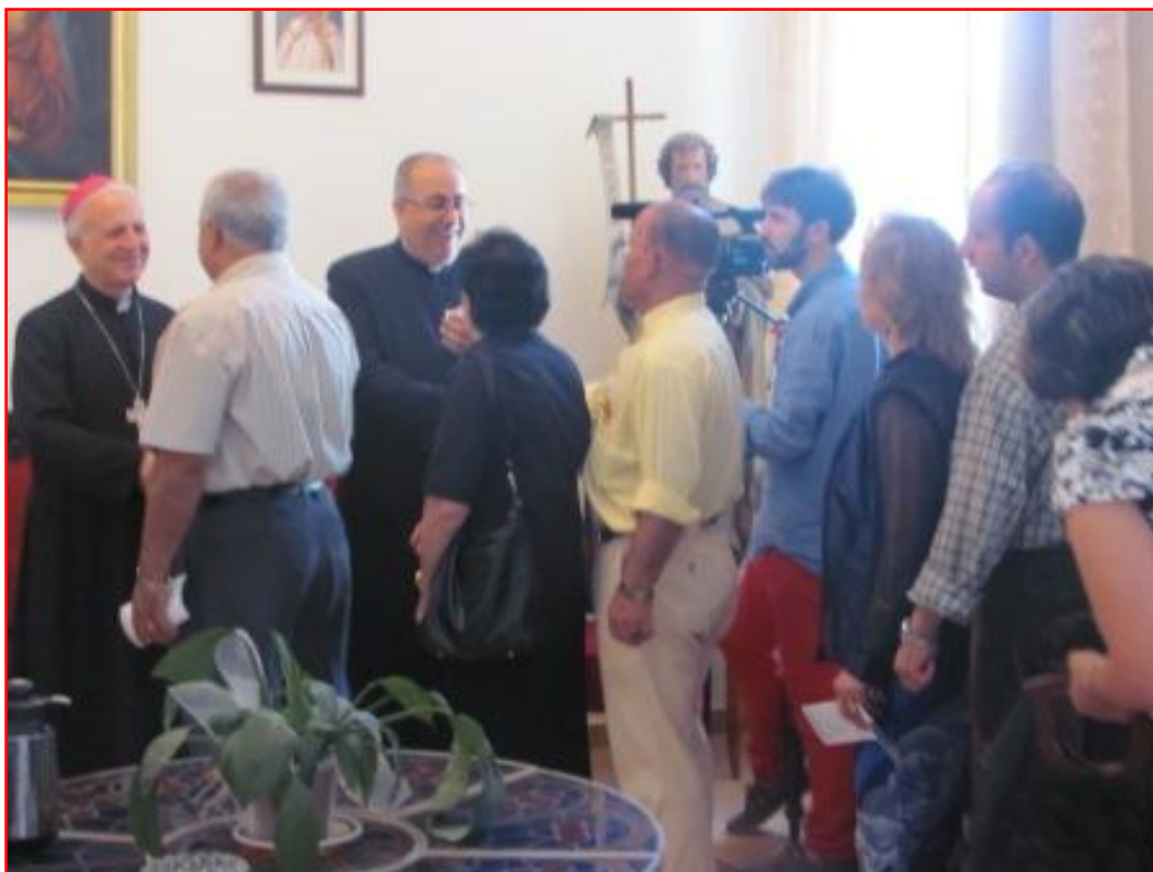
Salutations et remerciements après la messe