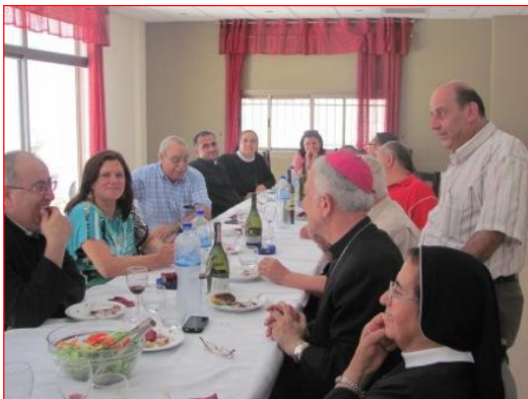
Repas avec le Conseil paroissial

MERCI Abouna... et bonne route au service du Seigneur et des hommes !