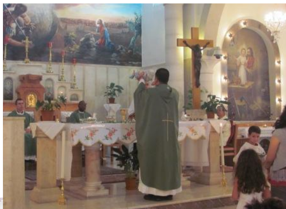
Participation à la messe dominicale au cours de laquelle deux familles présentent leur enfant nouveau-né.