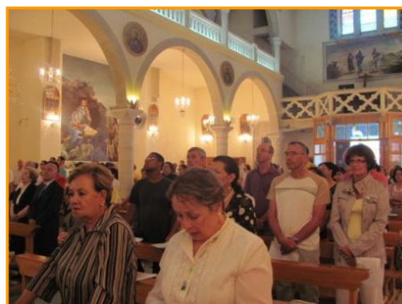
Participation à la messe dominicale de 10 h 15