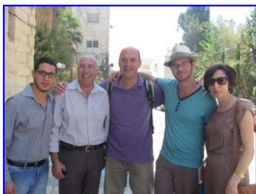
Accueil et hébergement dans les familles

** des pèlerins du diocèse d'Annecy (Haute Savoie)