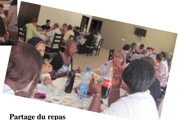
Partage du repas au restaurant de la section hôtelière